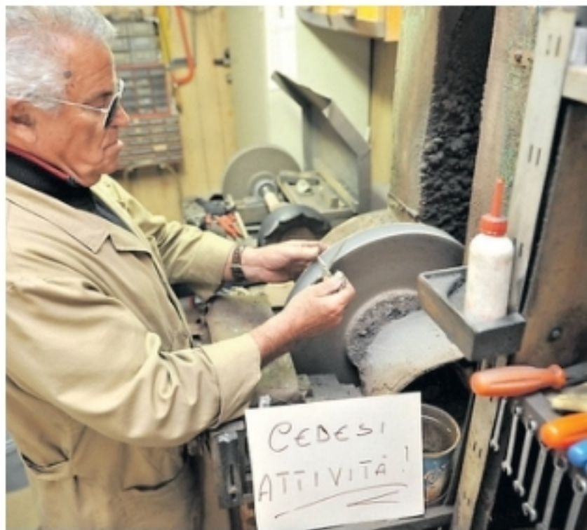
Anche il settore dell'artigianato rischia pesanti conseguenze

dalle previsioni della Cna sul prodotto interno lordo: «Potrebbe crollare del 9,6 per cento - spiega l'Ufficio studi - o addirittura del 15». Questo significa che l'economia sarda nel 2020 «rischia di vedere andare in fumo come minimo 3 miliardi di euro (4,4 miliardi nel caso del protrarsi delle restrizioni fino a giugno). «La Giunta regionale riprogrammi con urgenza le coordinate entro cui collocare lo