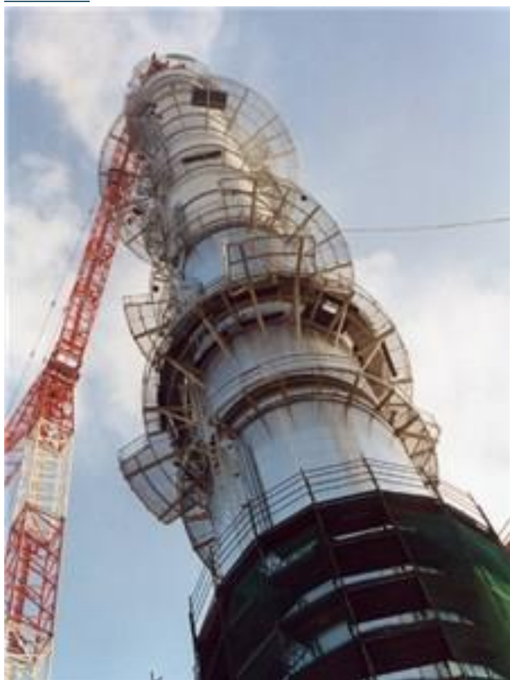
Una ciminiera in costruzione

L'emergenza sanitaria rischia di avere un impatto sull'economia della Sardegna ancora più devastante rispetto al resto d'Italia. Nonostante l'Isola sia stata colpita dall'epidemia in misura meno grave soprattutto rispetto alle regioni del Nord-Ovest (come tutto il centro-sud, d'altronde) le conseguenze del lock-down e della riduzione della domanda aggregata che condiziona la fase di ripartenza lasceranno il segno: considerando che ad inizio anno le attese erano per una seppur blanda crescita economica (intorno al +0,3%), l'economia sarda nel 2020 rischia di vedere andare in fumo come minimo 3 miliardi di euro (4,4 miliardi nel caso del protrarsi delle restrizioni fino a giugno).